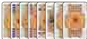
8 каждого из 5 цветов